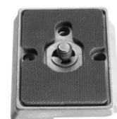
Die Platte wird mit dem Gerät verbunden