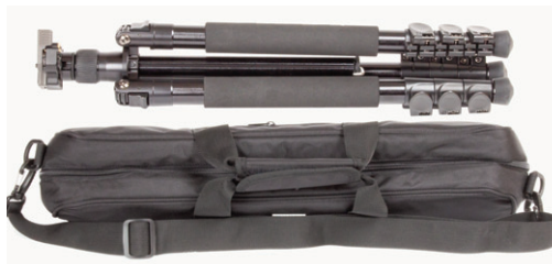
Lieferung mit Transporttasche