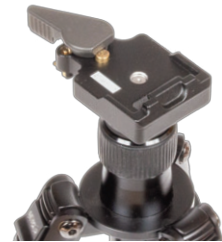
Serienmäßig mit Schnellwechseladapter