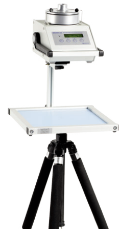
Probenahmesystem montieren - Fertig!