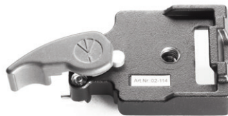
Das Unterteil wird auf den Träger von DuoSta oder auf das Stativ aufgeschraubt