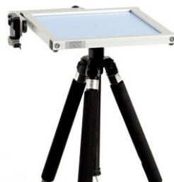
DuoSta auf Stativ montieren

Der Aufbau von DuoSta ist schnell und einfach: