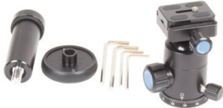
Weiteres Zubehör im Lieferumfang