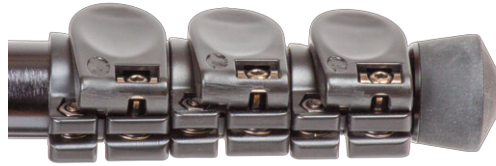
Schnelle Beinarrretierung mit Hebeln