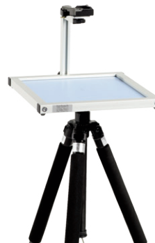
Geräteträger aufstellen und fixieren