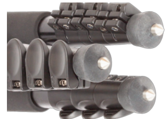
Ausdrehspeikes für sicheren Stand im Außenbereich